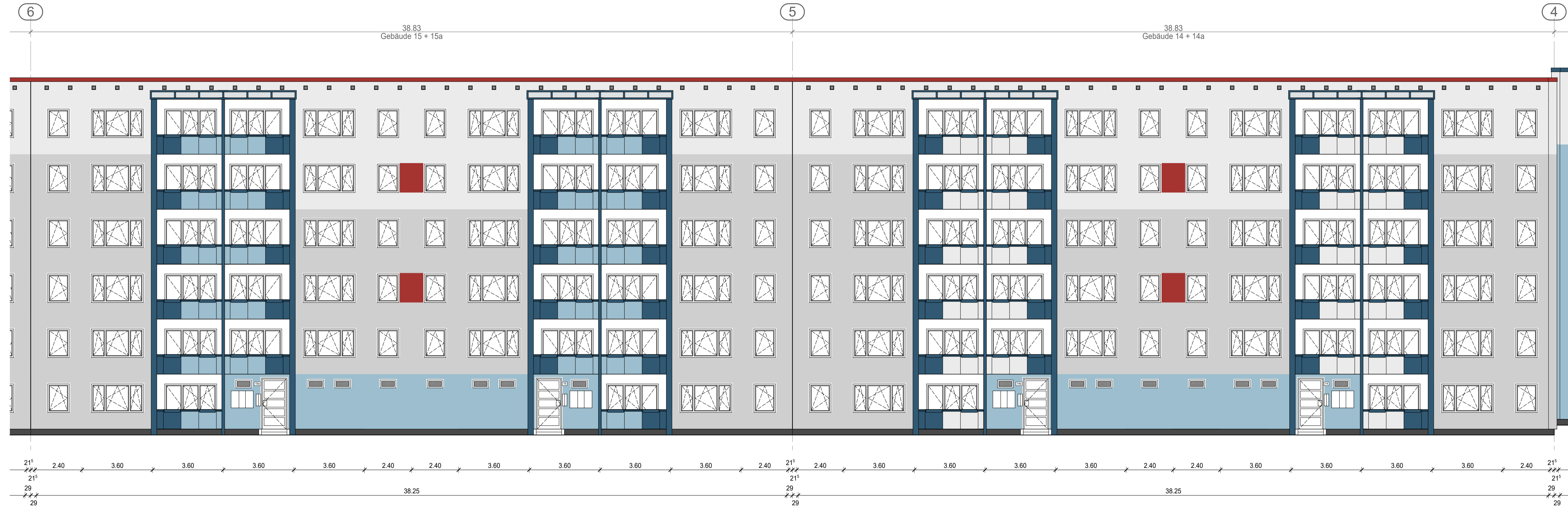
WESTANSICHT GEBÄUDE 14 + 15 M 1:100